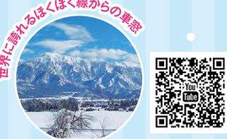
世界に誇れるほくほく線からの車窓