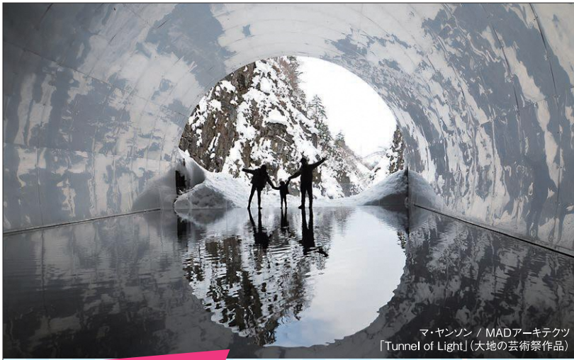
マ・ヤンソン / MADアーキテクツ 「Tunnel of Light」(大地の芸術祭作品)