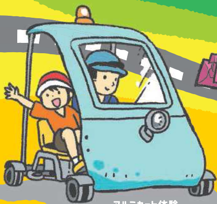
アルミカート体験